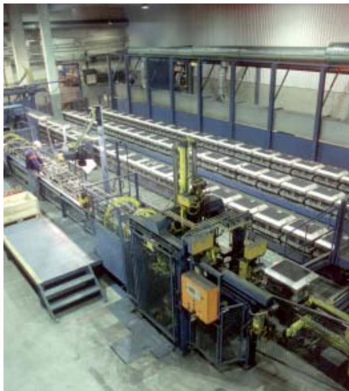
Stora investeringar har gjorts i ny produktionsutrustning.

AB Holsbyverken med dotterbolagen Nordcast AB, Älmhults Gjuteri AB och AB M Lundgrens Gjuteri i Halmstad är en av de största tillverkarna av gjutgods i Sverige. Totalt tillverkas ca 10 000 ton i gruppen, därav ca 4 000 ton gråjärn och segjärn från Holsbyverken. Gjuterigruppens omsättning är ca 225 Mkr på 150 anställda.