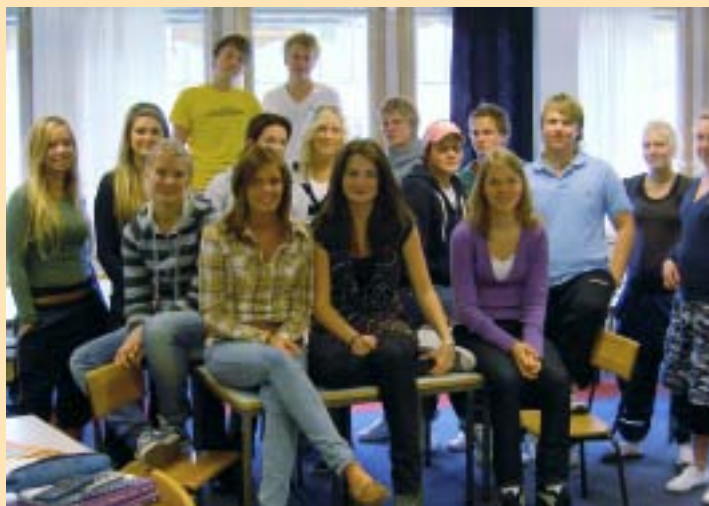
Eleverna i klass SP2A vid Njudungsgymnasiet ser fram emot en praktik hos dig!

Skolan hoppas på att eleverna ska få inblick i bl a något eller några av områdena försäljning, bokföring, administration, personalfrågor, reklam, inköp, kalkylering, organisation, budget samt att få ställa upp på allehanda utredningsuppdrag alltefter ålder och fallenhet. Se www.vetlanda.se/njudung eller e-posta per-olof.albertsson@utb.vetlanda.se .