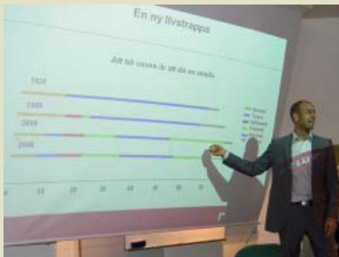
Den s.k. frihetstiden ökar även hos de vuxna.

Sökande efter möjlighetsplattformar påverkar ungdomarnas val av arbetsgivare, men med alla val ökar också behovet av vägvisare som de känner förtroende för. Är du redo att vara vägvisare och möta morgondagens vuxna?