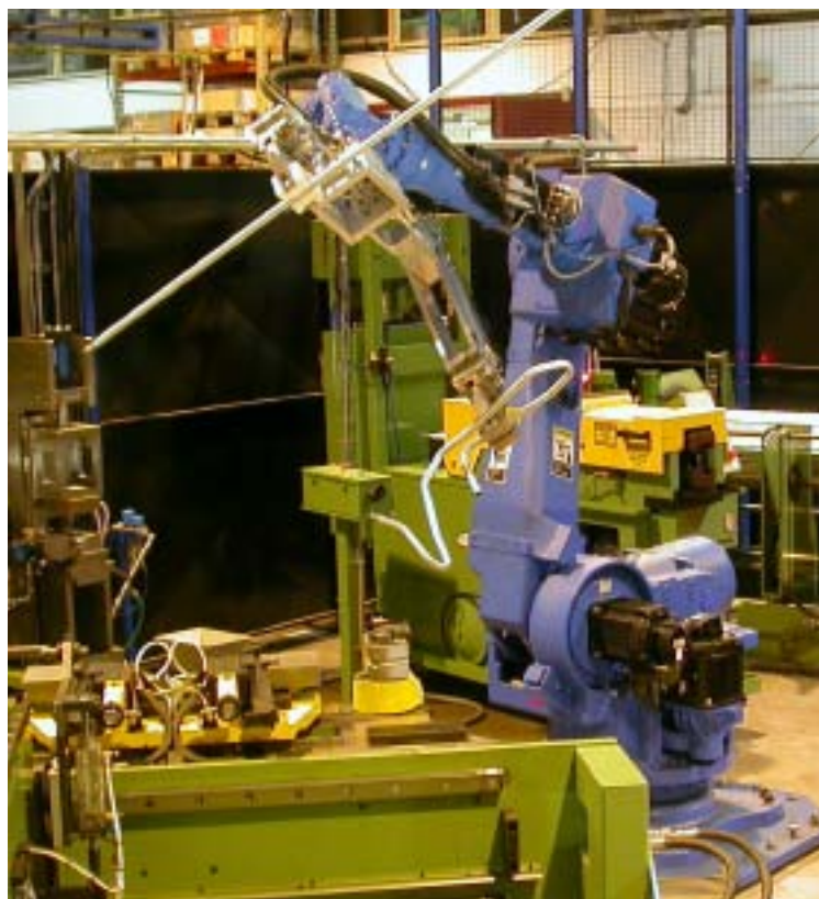
En robotcell på EMA för automatisk ändformning, håltagning och bockning.