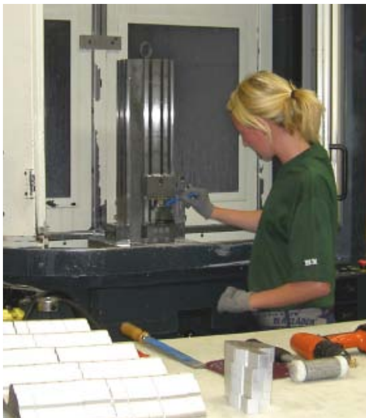
På BMA är engagemanget och kompetensen hög.

Kontakt: Björkö Mekaniska Tfn 0383-318 50, info@bma.se , www.bma.se