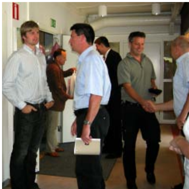
Invigningen den 25 september lockade många besökare till Fixits lokaler.